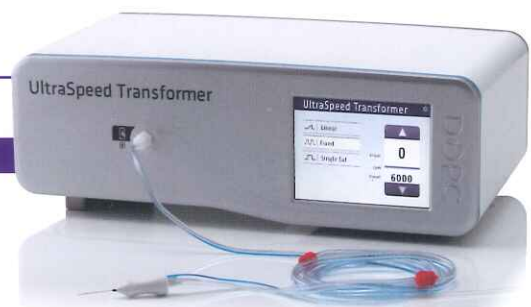
Aspiration 25G vitrectome @ max mmHg

AU-1265UST ウルトラスピード トランスフォーマー 認証番号: 225AGBZX00053000